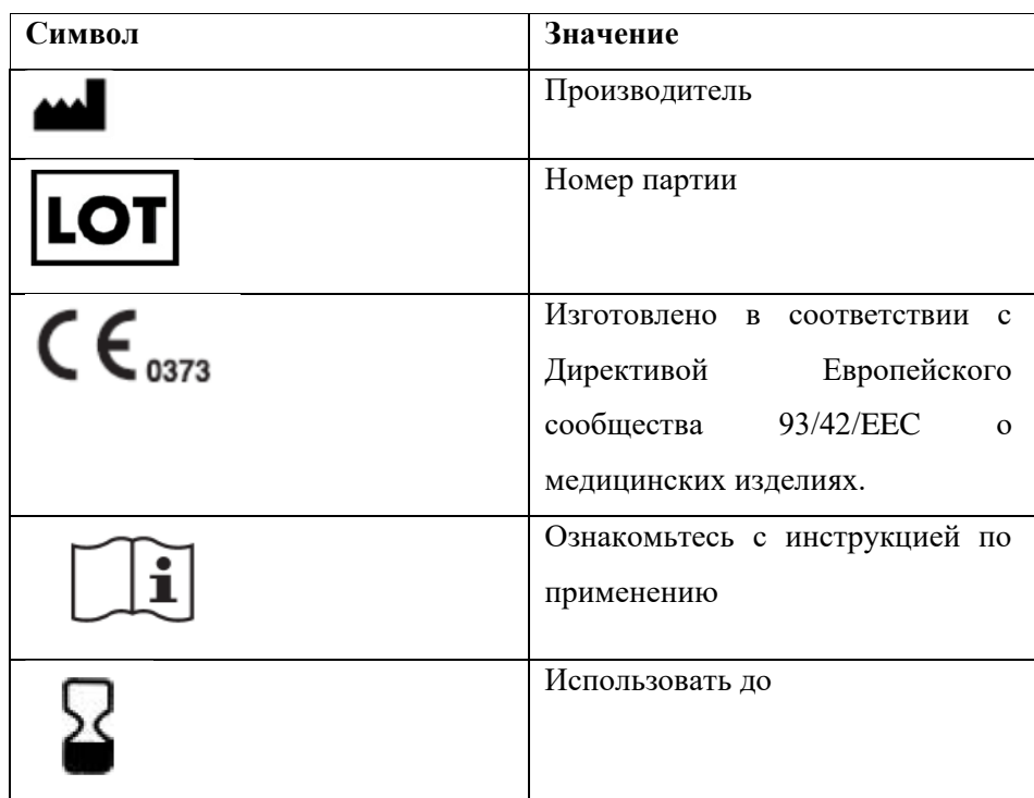
ТАБЛИЦА УСЛОВНЫХ ЗНАКОВ

ХРАНЕНИЕ: При температуре от +5 °С до +30 °С. Не замораживать.